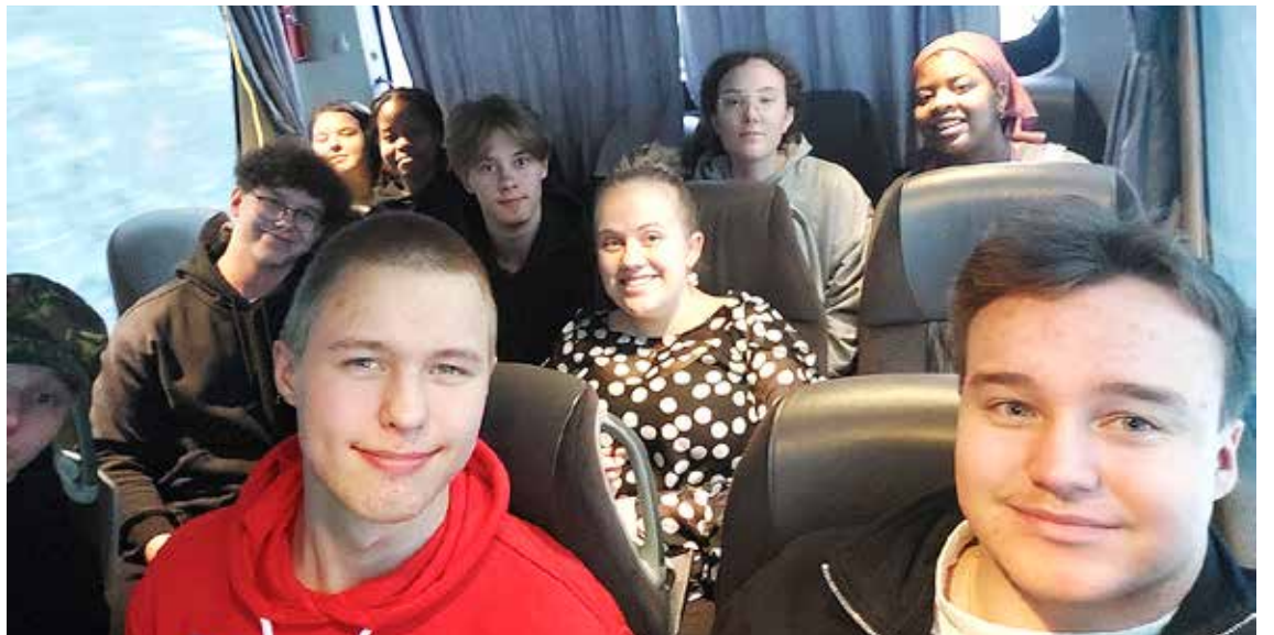
Linja-autokuljetus tapahtumaan lähti Oulusta aamukuudelta. Kuvassa oikeassa alareunassa jutun kirjoittaja.

Monet kuvailivat, että tunsivat kuuluvansa yhteen muiden kanssa Jumalan läsnäolon alla.